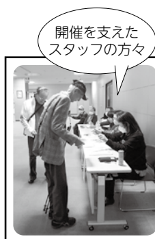
開催を支えたスタッフの方々