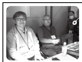
ステージ脇のブースで作業中のスタッフ