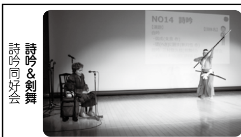
詩吟&剣舞 詩吟同好会