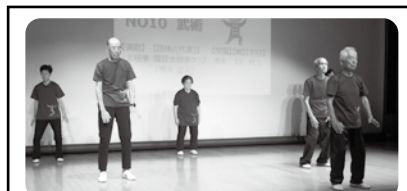
武術 太極拳 園芸太極拳クラブ