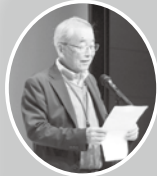
いきいき同窓会会長