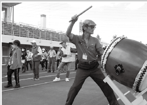
別府実行委員長が渾身のバチさばき披露